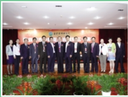
职能部门代表合影