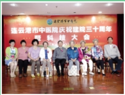
离退休老同志代表合影