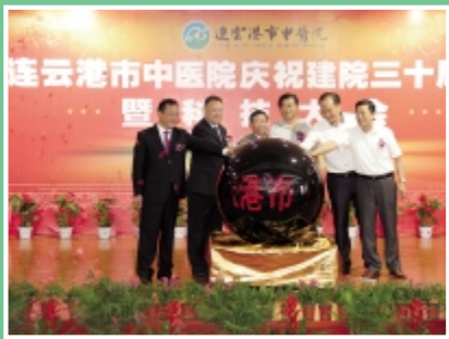
连云港市中医院中医药发展基金会及赵化南青年科技基金会成立