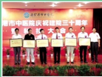
周炜书记为科技引进与创新作出突出贡献的团队代表颁奖