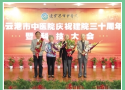
为老专家代表献花