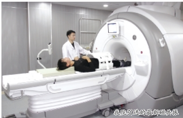
我院引进的最新磁共振

为进一步发挥中医药特色优势,我院在全力打造专科、专家、专药的特色基础上,又增设和开设了肝胆脾胃、肾病、糖尿病等一批专病。看病按“病”不按“科”,这种全新的求诊路径为社会提供了优质的中医药服务。