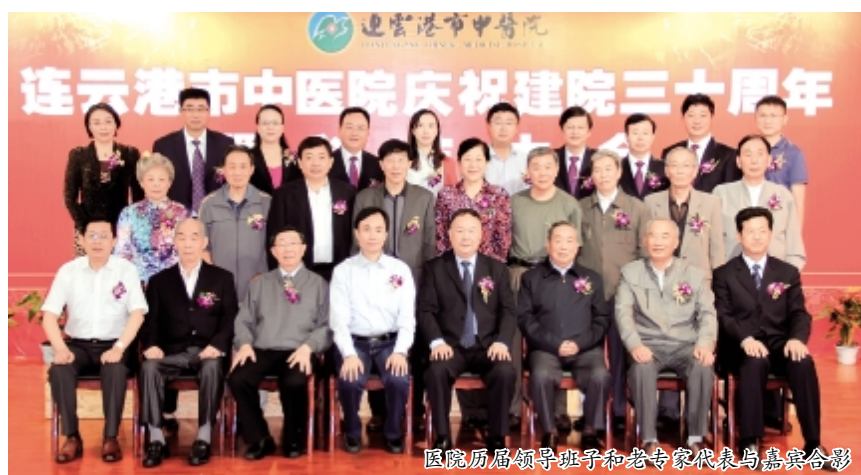
医院历届领导班子和老专家代表与嘉宾合影

十周年华诞表示祝贺，对三十年来所取得的科技成就给予充分肯定，并对我院三十年来为港城卫生事业和中医药事业所作出的突出贡献表示感谢。滕雯部长希望我院