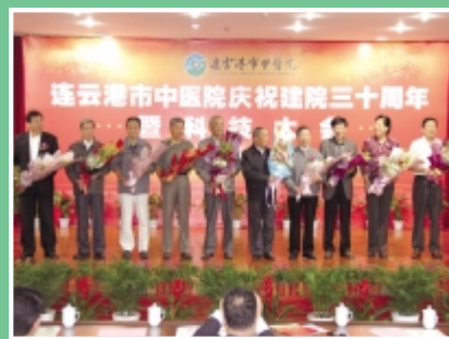
为历届老领导代表献花