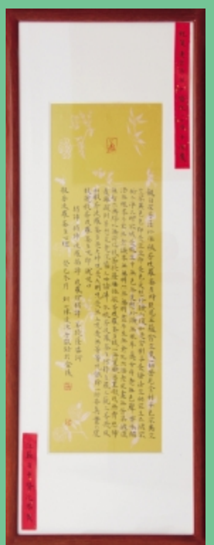
江苏省中医院贺匾