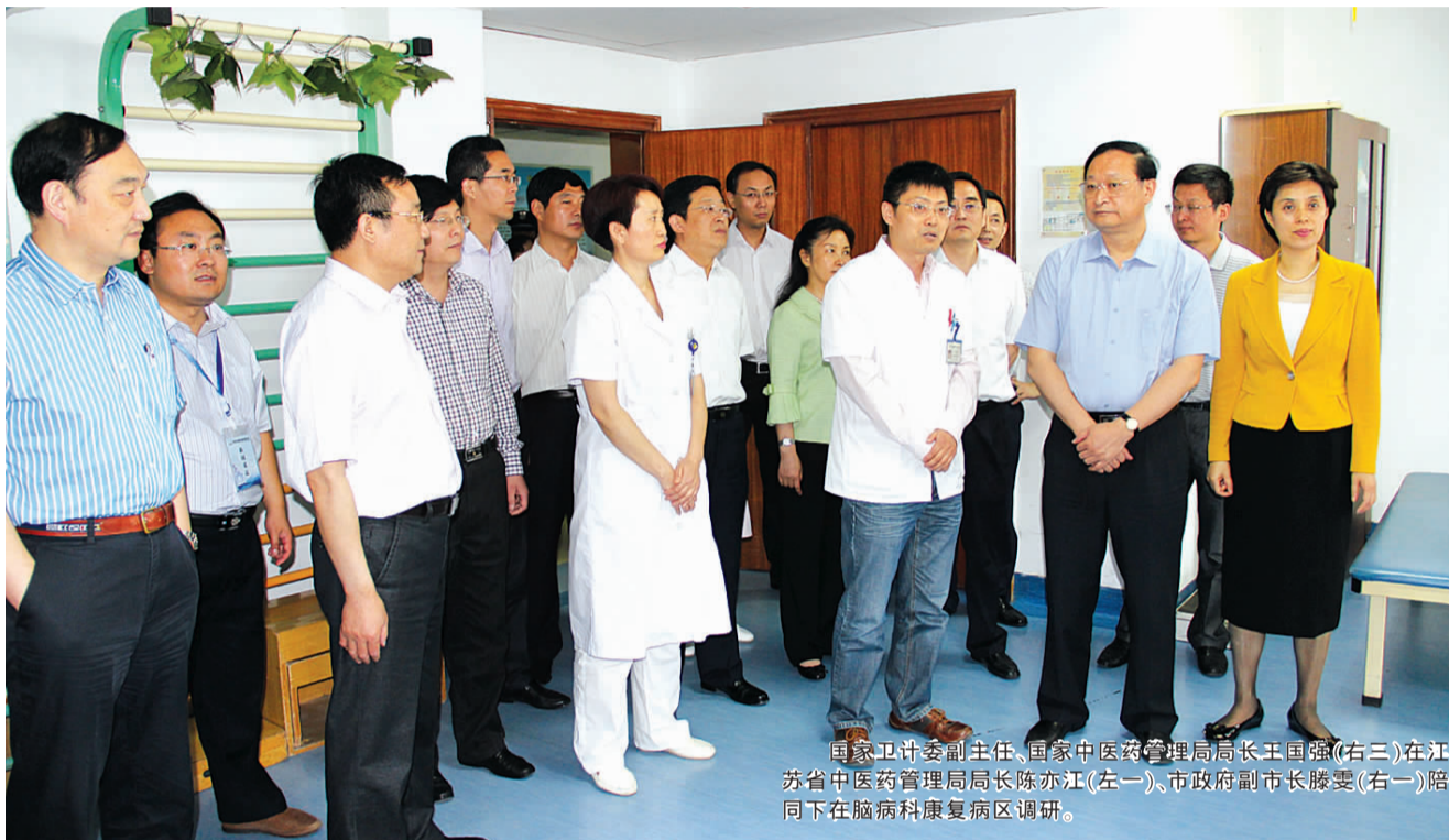
国家卫计委副主任、国家中医药管理局局长王国强(右二)在江苏省中医药管理局局长陈亦江(左一)、市政府副市长滕雯(右一)陪同下在脑病科康复病区调研。