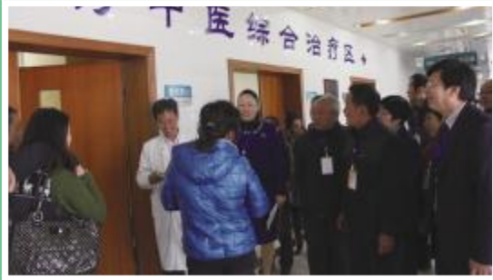
市民代表参观中医综合治疗区