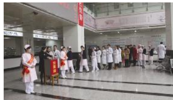
“十佳员工”民主投票