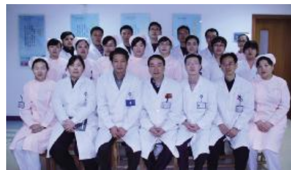
国家重点建设专科—针灸科团队