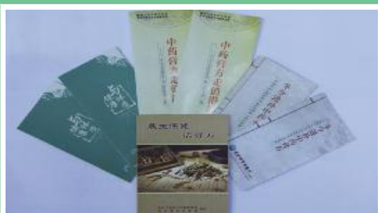
印制多种宣传资料