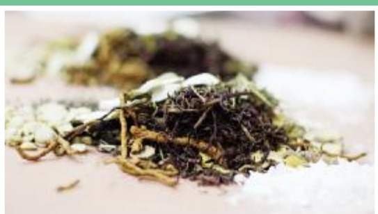
选用上等名贵药材