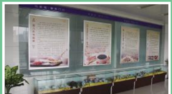
中药膏方文化长廊