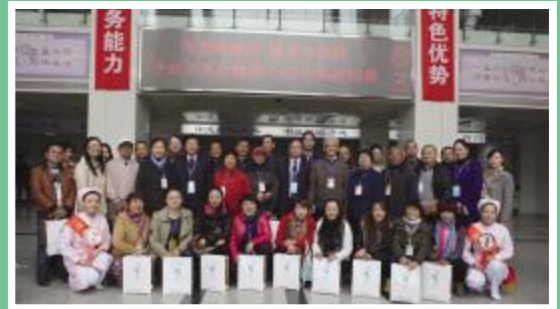
市民代表与院领导合影