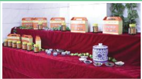
我院制作的各品种规格的膏方