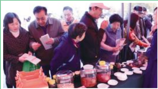
市民争相品尝膏方