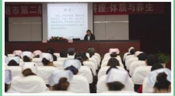
体质与养生健康讲座