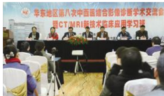
举办省级继续教育项目