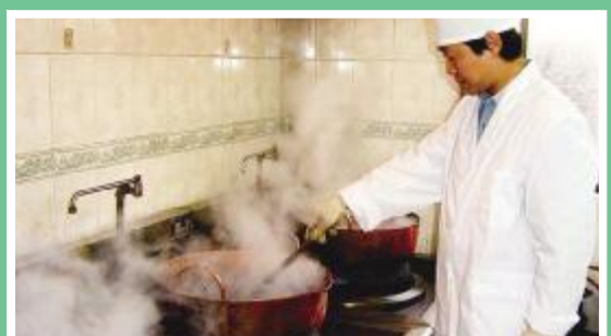
精心熬制每一料膏方